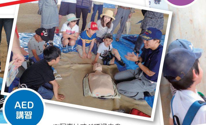
※写真はすべて過去の 防災フェスタの様子です