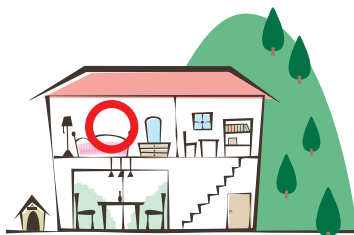
高い階、山と反対側へ!

夜間、すでに豪雨や強風、避難路が水没しているなどで避難が困難な場合には、自宅や近くの頑丈な建物のできるだけ高い階に避難しましょう。(土砂災害の危険もあるので山側の部屋は避けましょう。)