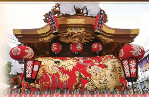
豪華絢爛な龍虎の刺繍が施された見送り幕。特徴あるその形は「宝塚型」と呼ばれ、中に詰め物を入れ、ふっくら丸く優美さを強調。

れてきて良かった!とおっしゃいます。昔ながらの米谷の細い道を拍子木の合図で皆で息を合わせ、ギリギリのところをすり抜けていく。力だけではなく、長年の勘や仲間との信頼関係。いろいろな要素が上手にかみ合ってこそその感動がそこにあるといえます。以前の「男の祭り」というイメージも、今では多くの女性も参加、華やかさを添えています。だんじり本体もコマ(車輪)や持ち手に工夫を凝らすなど、時代の変化に合わせて進化しているようで、「お祭りの時には、ぜひ触ってみて!」とのこと。一方、宝塚市内で唯一、東・西2台のだんじりを保有する米谷地区は、曳き手の減少が深刻な問題に。「子どもたちには、怖がらずに、どんどん来て、だんじりに触れて欲しい。そして『自分のもの』のように愛おしく思って次の世代に引き継いでもらいたい。」と熱弁されていました。