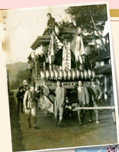
昭和15年(1940年) 紀元2600年記念行事の貴重な写真。当時は法被ではなく軍服を着用し、旭日旗も飾られていた。