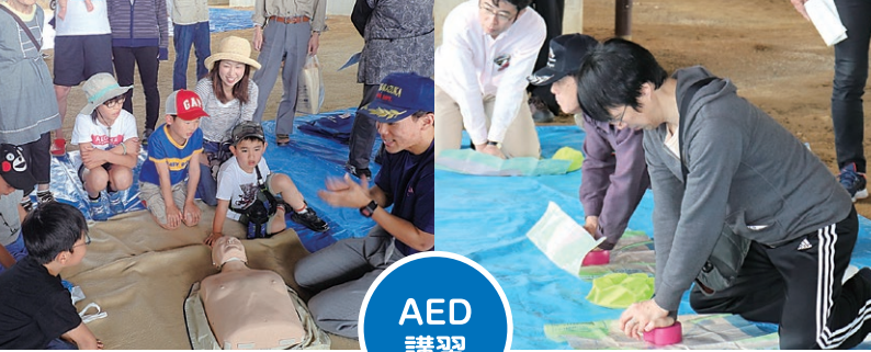
防災フェスタの様子です