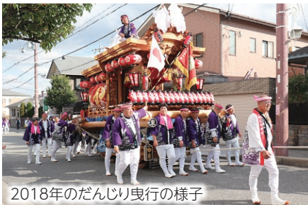
2018年のだんじり曳行の様子

3年ぶりの開催となるだんじりの曳行は1800年代から続く歴史あるお祭りです。米谷のだんじりは1つの町で2台のだんじりを