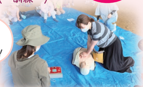
※昨年の防災フェスタの様子

とき 5/19(日) ●受付 AM9:30～ ●訓練 AM10:00～(正午頃まで)