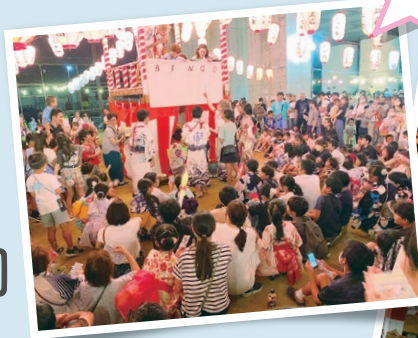
※昨年の盆踊りの様子